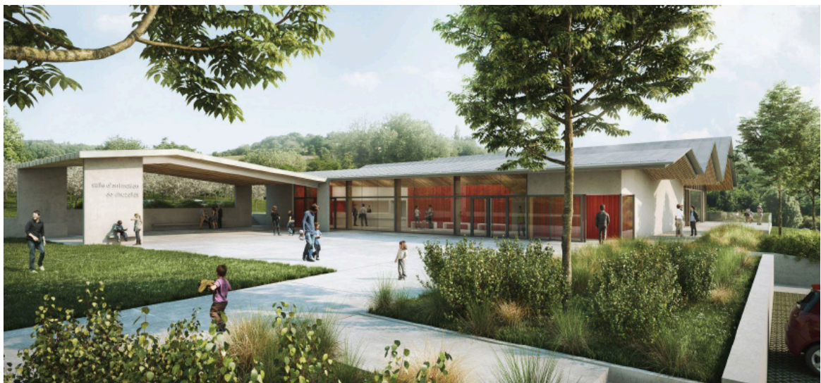
Perspective du projet (document d'esquisse susceptible de modifications – PLAYTIME/AA – 2016)

Une architecture contemporaine sera mise en œuvre, offrant à tous les chuzellois un équipement qui marque le dynamisme de la commune.