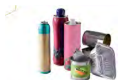
Aérosols, boîtes de conserve, bidons métalliques, canettes

Un doute ? Une question ? Le service environnement est à votre disposition au 04 74 53 45 16