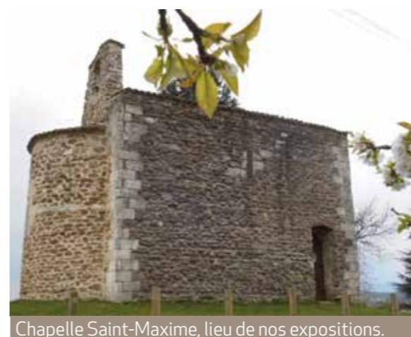
Chapelle Saint-Maxime, lieu de nos expositions.

Exposition « La boule lyonnaise à Chuzelles » le 27/07/2018.