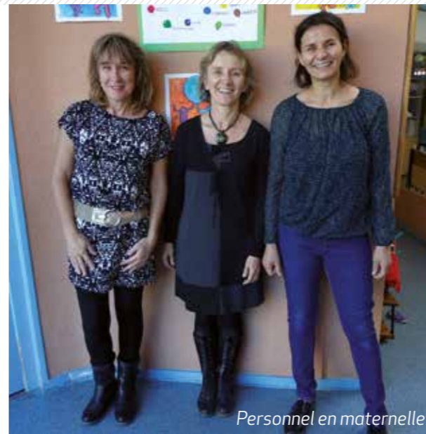
Personnel en maternelle

SOUS PEINE D'AMENDE ART R 633-6 DU CODE PENAL