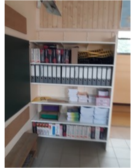
Réalisation et installation par nos agents de meubles de rangement dans 3 classes

Le plus gros chantier a été la réfection totale de la cour de l'école maternelle avec l'élimination des bordures, décapage et pose d'enrobé puis nivellement de l'ensemble. La cour ainsi réaménagée complète la partie jeux enherbée