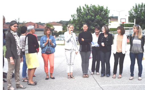
Une partie de l'équipe enseignante