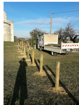
Chapelle Ste Maxime